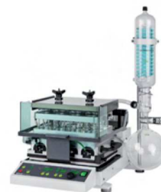
Syncore® Analyst Optimisez l'efficacité du traitement simultané de plusieurs échantillons

11592914 fr 1410 B / Les caractéristiques techniques peuvent être modifiées sans préavis / Systèmes de qualité ISO 9001. La version anglaise est la version originale et sert de référence à toutes les traductions.