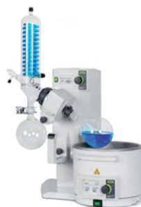
Rotavapor® R-215 L'excellence en matière d'évaporation