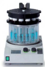
Multivapor™ P-6 / P-12 Évaporation efficace pour plusieurs échantillons