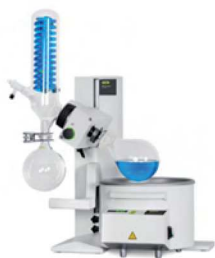
Rotavapor® R-100 Évaporation économique