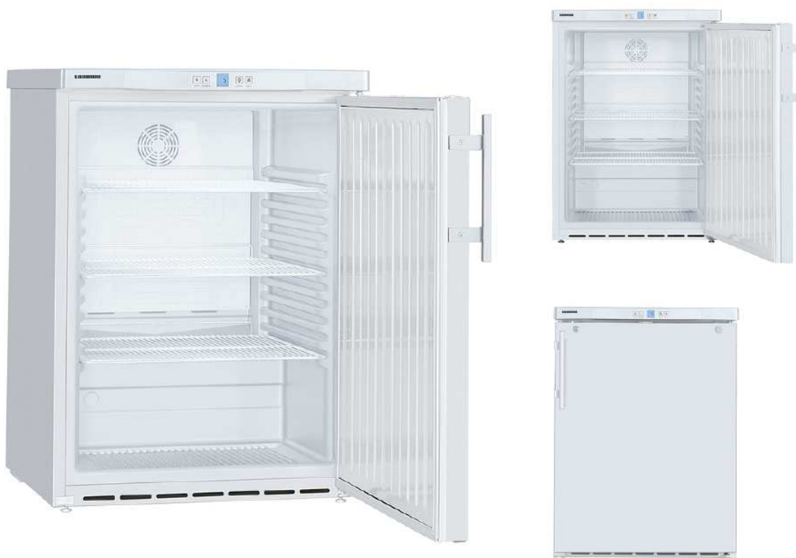
Table top positif, carrosserie epoxy Blanc, 134L