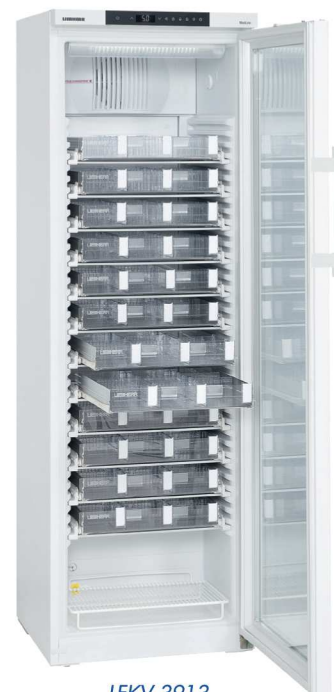
LFKV 3913 avec tiroirs en accessoires